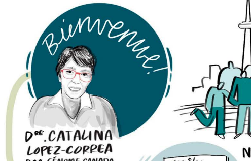
TABLE RONDE DES LEADERS sur L'AVENIR DE LA GÉNOMIQUE AU CANADA 21 OCTOBRE 2021 - 3 e TABLE RONDE

APPEL DEPUIS LA TERRE DU PEUPLE ALGONQUIN ANISHINAABE UN MOMENT POUR UNE COMMUNICATION VRAIMENT OUVERTE